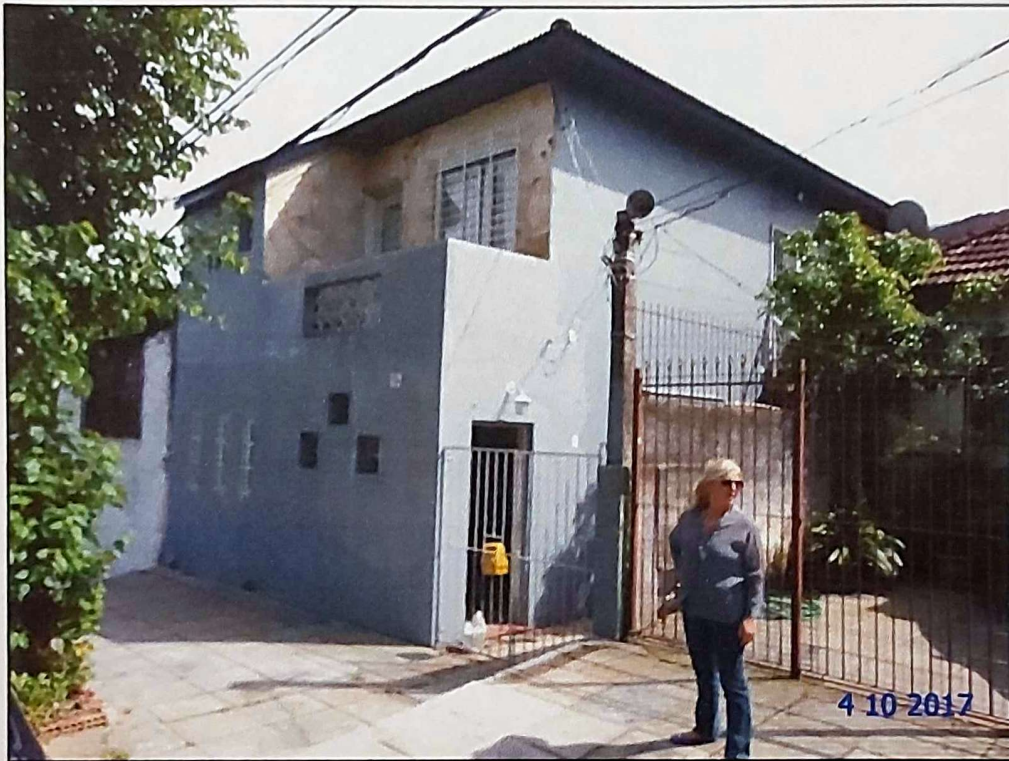
Casa e terreno avaliando.